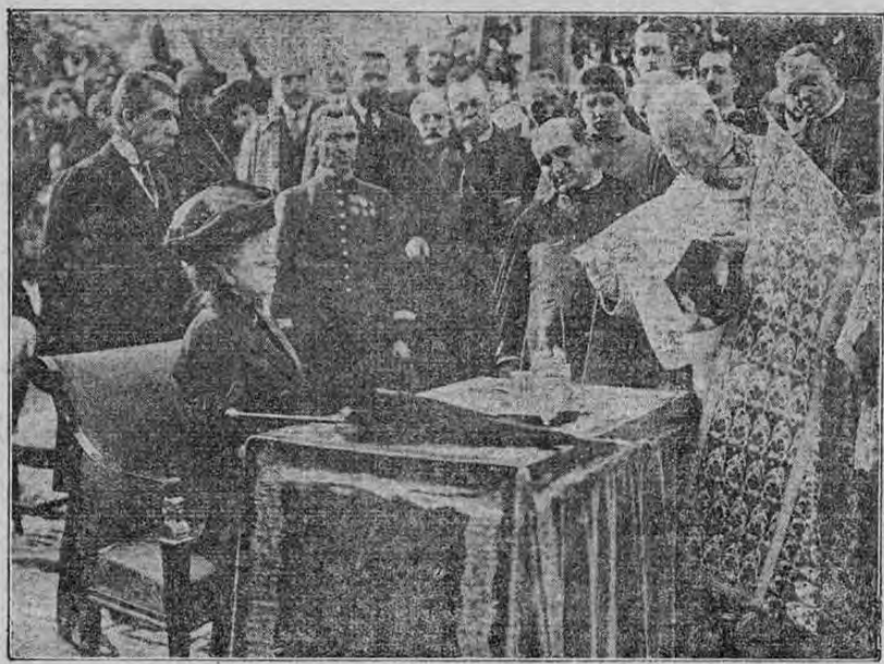
La Reina Madre Cristina y el Ministro de Instrucción en la ceremonia de poner la primera piedra de una escuela para enseñanza católica conforme al sistema del ilustre pedagogo español Majón, que ha sido ensalzadísimo en España y Alemania.