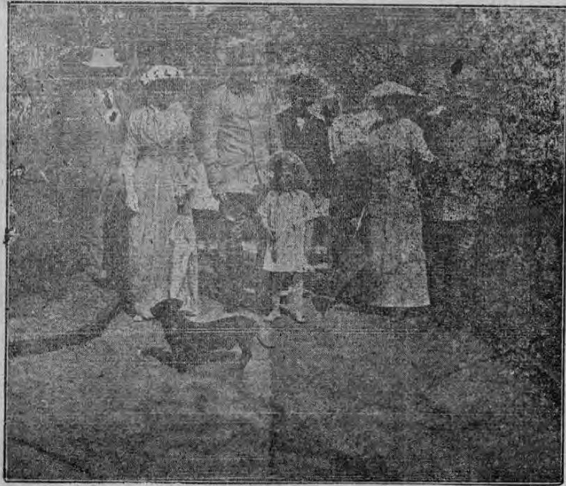
GUILLERMO DE WIED

Soberano de Albania, con su familia paseando por uno de los Parques de Durazzo, Capital del Reinado Albanés.